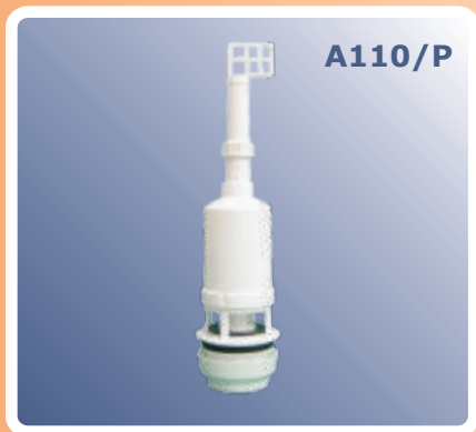
Zvono za vodokotlič