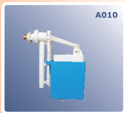
Kasetni ventil plovak za vodokotlič