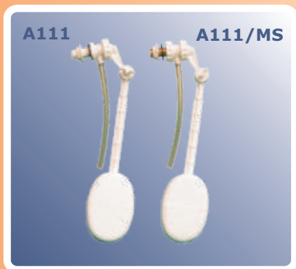
Ventil plovak za vodokotlič PPE i MS