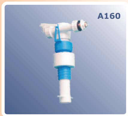
Lift plovak za vodokotlič