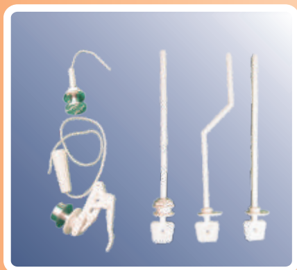
Potezači i poluge za vodokotlič