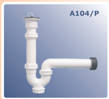
Šifon za lavabo/sudoperu 1/1